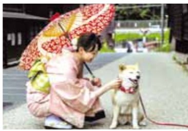
共催:信濃毎日新聞社 協力:モナミ・イワサ理美容室 【お問合せ先】アド・コマース(株) 090-5591-9566